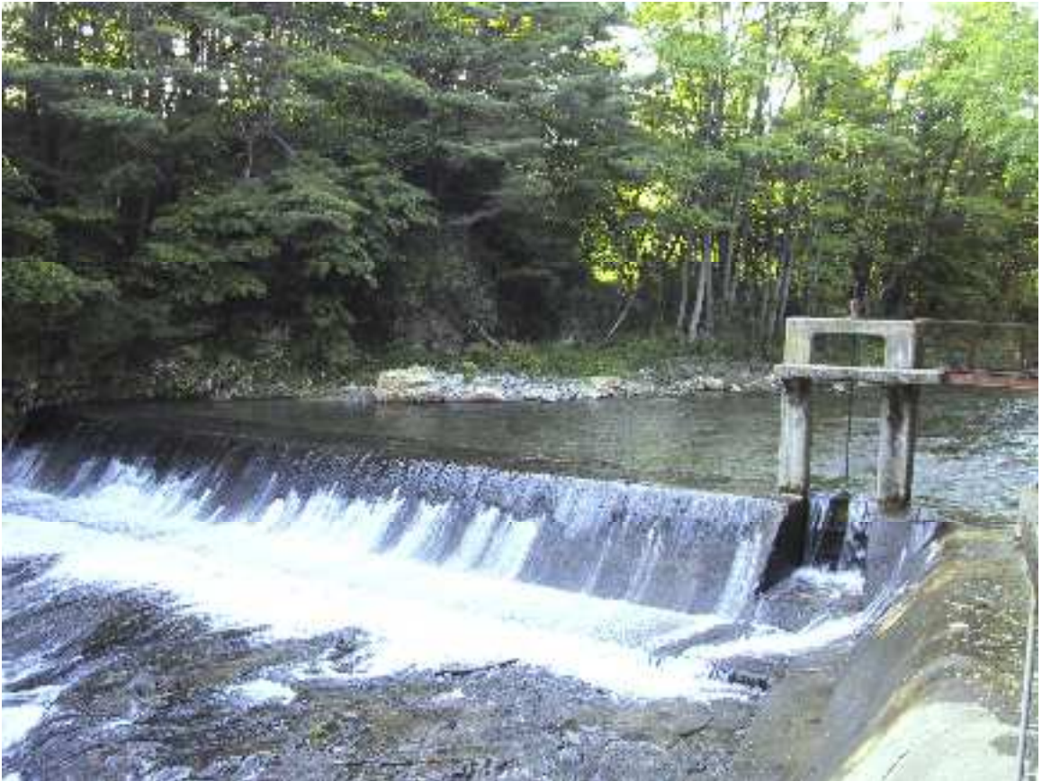
水源：石筵川 日影沢堰