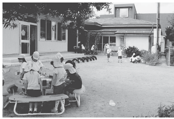
▲園庭での活動の様子

岩根幼稚園には、96人の園児が在園しています。みずきが丘住宅団地ができたことにより年々入園児が増え、平成22年4月より4クラス編成になりました。現在みずきが丘からの通園数は80%を占めています。 教育目標に「明るく元気な子ども」「よく見、よく考えて行動する子ども」「心豊かな子ども」を掲げ、子どもたちの健やかな成長を願って日々保育を行っています。 年間を通していろいろな行事があり、どの行事にもPTAの皆さんに保育サポートとしてご協力をいただいています。 また、岩根幼稚園には「かめきち君」というアイドルがいます。「かめきち君」は年長児が中心となって世話をしている亀です。水を交換したり、エサをあげたりする世話を、「かめきち君の絵」もたくさん描きました。時々かめ