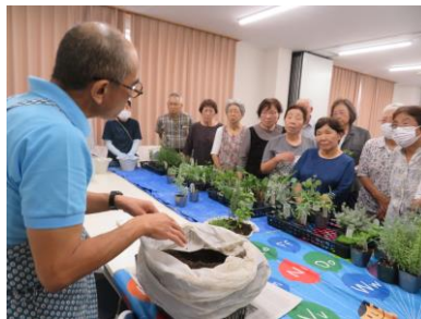
【創作活動】 ハーブで寄せ植え教室