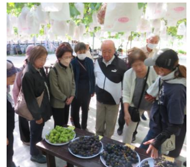
【市外研修】福島方面 古閑裕而記念館 文知摺観音 ブドウ狩り体験