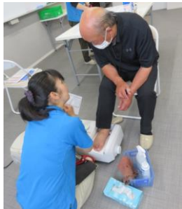
【健康教室】 骨密度測定 丈夫な骨で健康な生活を