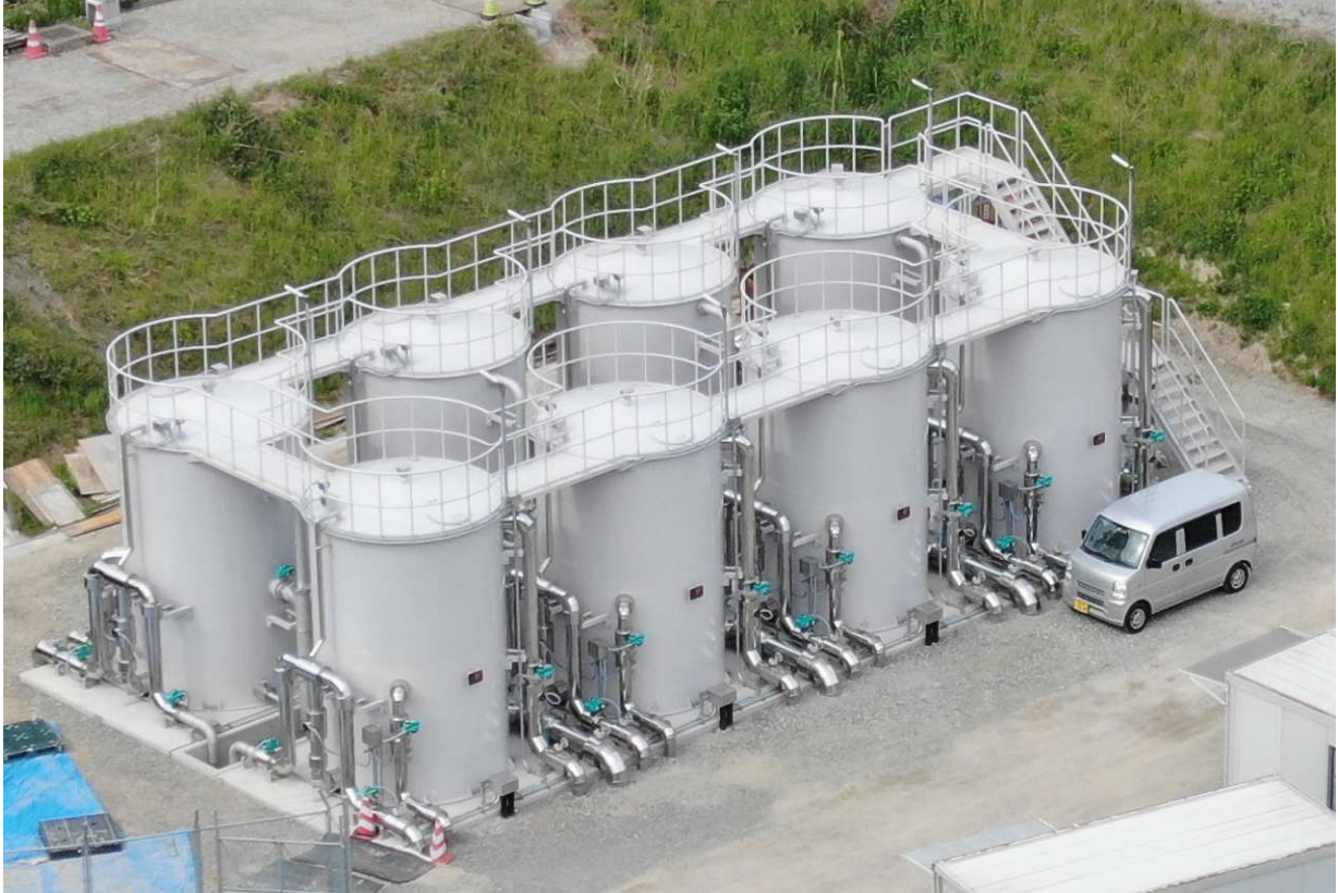
立石山浄水場2系ろ過機(令和5年12月完成)