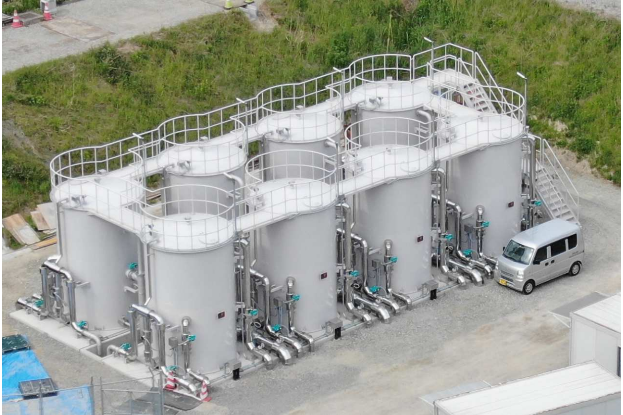
立石山浄水場2系ろ過機(令和5年12月完成)