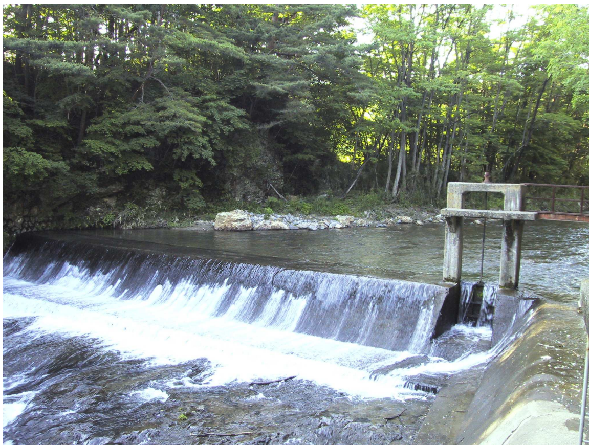
水源：石筵川 日影沢堰