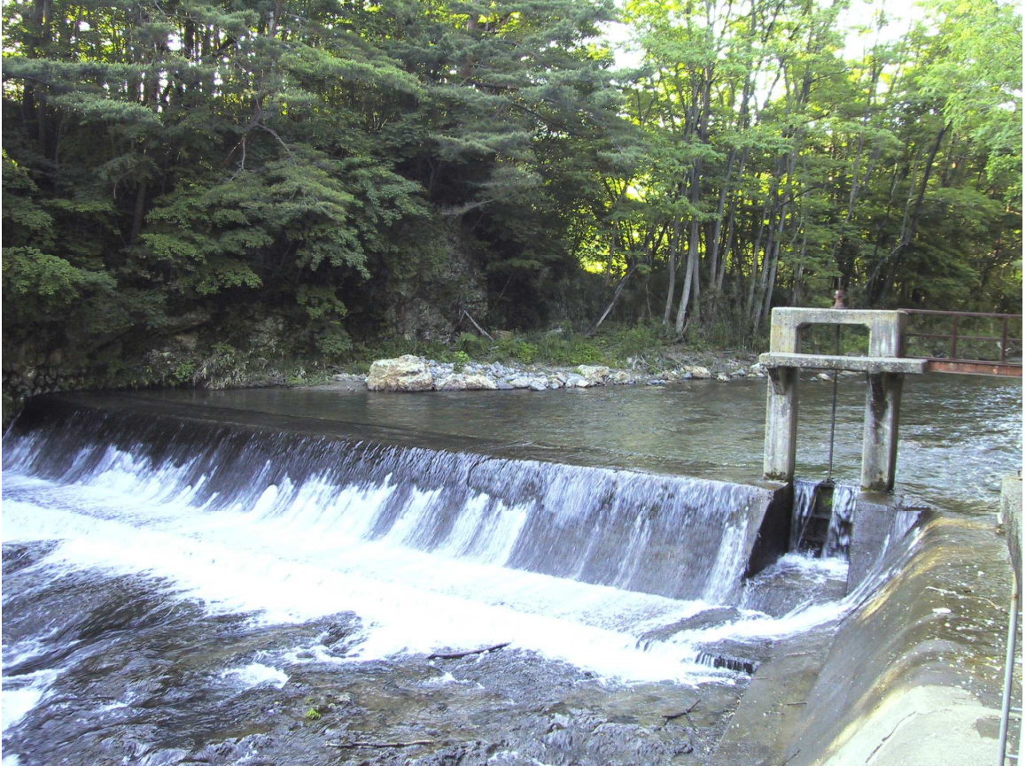
水源：石筵川 日影沢堰